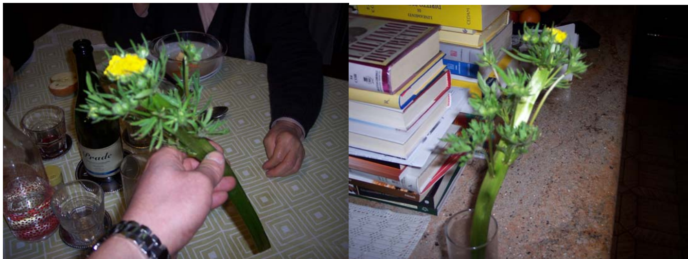
Piantina di "ranuncolo" MUTAGENO !

MA DOPO L'ARRIVO DELLE ATTIVITA' "INSALUBRI", A SAN PIETRO E DINTORNI...ECCO I RISULTATI !!!