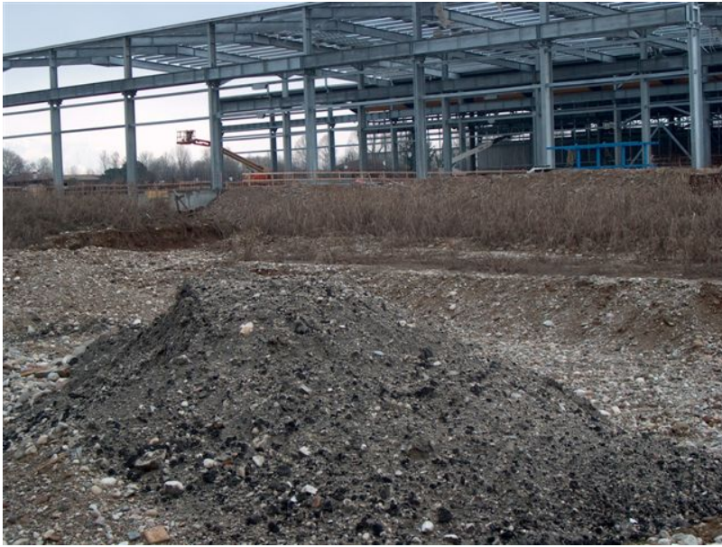
scorie di fonderia

Vi ricordiamo ...che nel nostro PIP 49 vi sono :