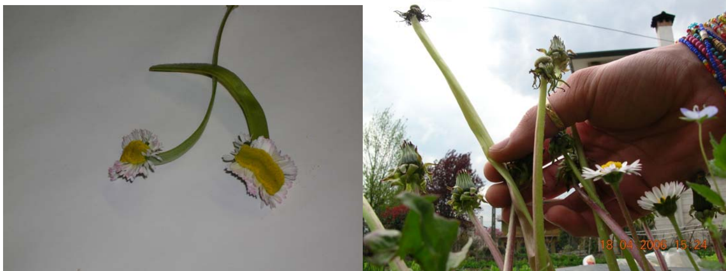
Margherite e Tarassaco MUTAGENI !

Dormite bene gente ? Dormite ! ... Dormite !